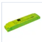
19371 INV P&L LED SE/SA 3H 60-180V