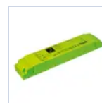
19367 INV P&L LED SE/SA 1H 60-180V