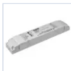
19399 INV UNIV CT 5W 20-240V