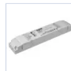
19398 INV UNIV AT RM 5W 20-240V