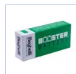
RA13 BOOSTER BAT LiFe 6.4V 1.5Ah