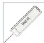
15037 MODULO LGFM