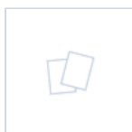
15079 MODULO LG SLIM